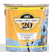
Pusmatēta akrila krāsa