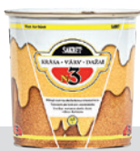
Pilnīgi matēta akrila krāsa