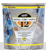
Pusmatēta akrila krāsa