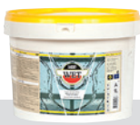
Krāsa mitrām telpām