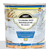
Krāsotāja grunts–griestu krāsa