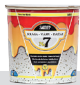
Matēta akrila krāsa